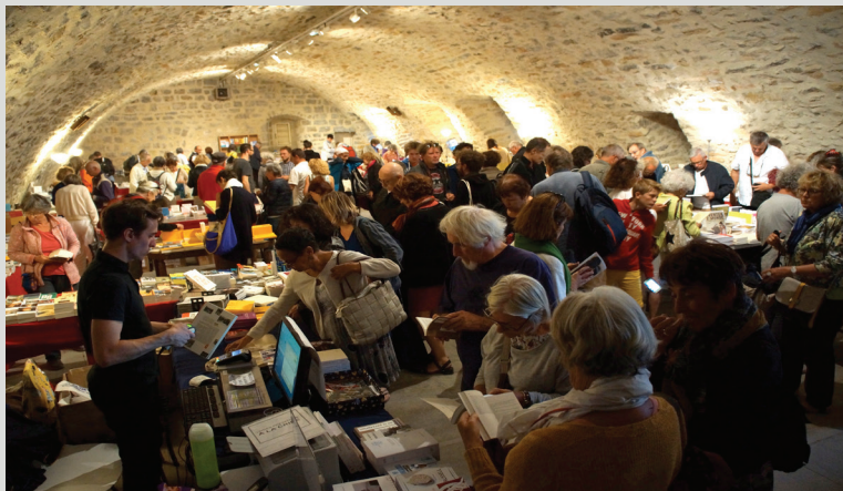
La grande librairie du Banquet d'été dans le cellier des moines.