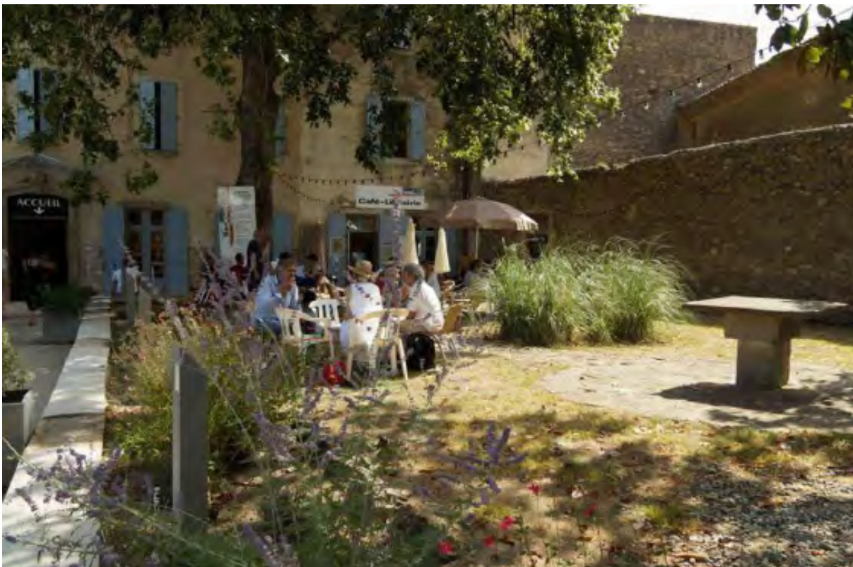
@ La Maison du Banquet et des générations